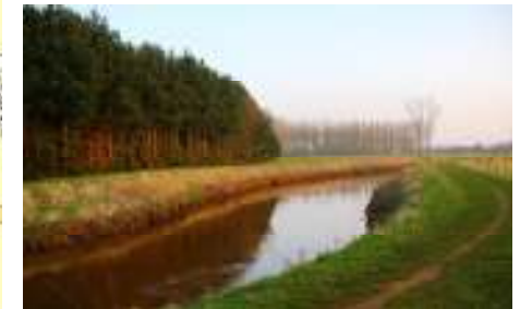
De Nete ter hoogte van de Herebossen